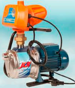
Isku-Jet vesipumppu Hinta alk. 320 €