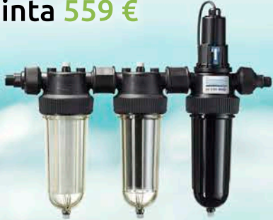
Watman Trio-UV Hinta 559 €