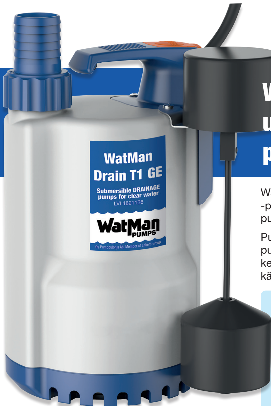
Tehokäyrät WatMan Drain T1 GE ja T3 GE